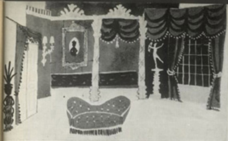
Maquette de Serge Creuz pour le décor du IV e acte

LA TRIBUNE DU C. D. E. : émission bi-mensuelle passant le dimanche sur les antennes de Radio-Strasbourg, réalisée et interprétée par le C. D. E. Objectif : tenir au courant du travail du Centre les auditeurs et leur présenter en « avant-première » les meilleurs spectacles donnés à Strasbourg.