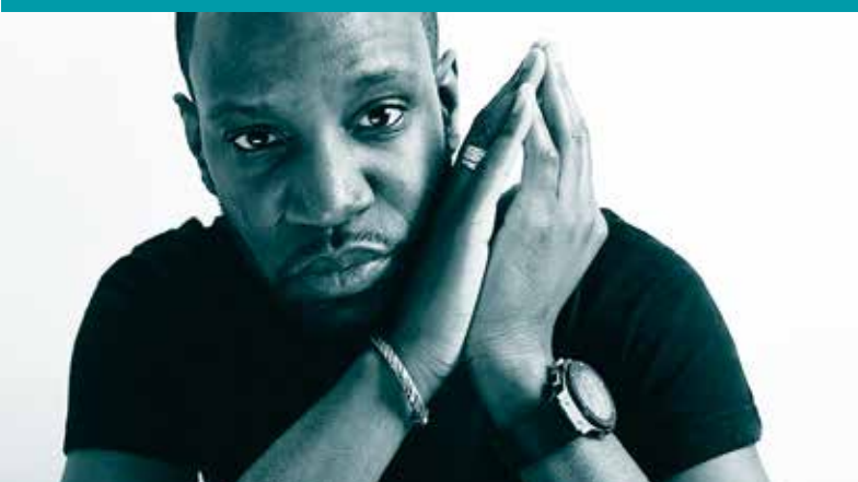
Abd al Malik